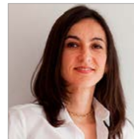
Yolanda Yuste YLAB ARQUITECTOS www.ylab.es