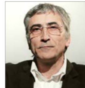
Joan Miró TBK www.tbk.es