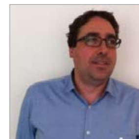
Joaquín Marco 3G OFFICE www.3g-office.com