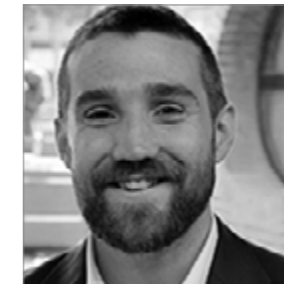
Chema Díez UIC BARCELONA www.uic.es