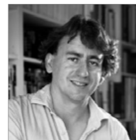
Miquel Àngel Julià NUKLEE / GRUP IDEA www.nuklee.com www.grupidea.com