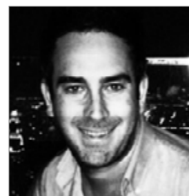
Eduard Albors GAC 3000 www.gac3000.com